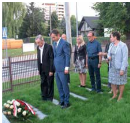
Delegacja Rady Dzielnicy XI Podgórze Duchackie

wyruszał z innymi na obronę Lwowa i dziękował wszystkim za kultywowanie pamięci o poległych w obronie Ojczyzny.