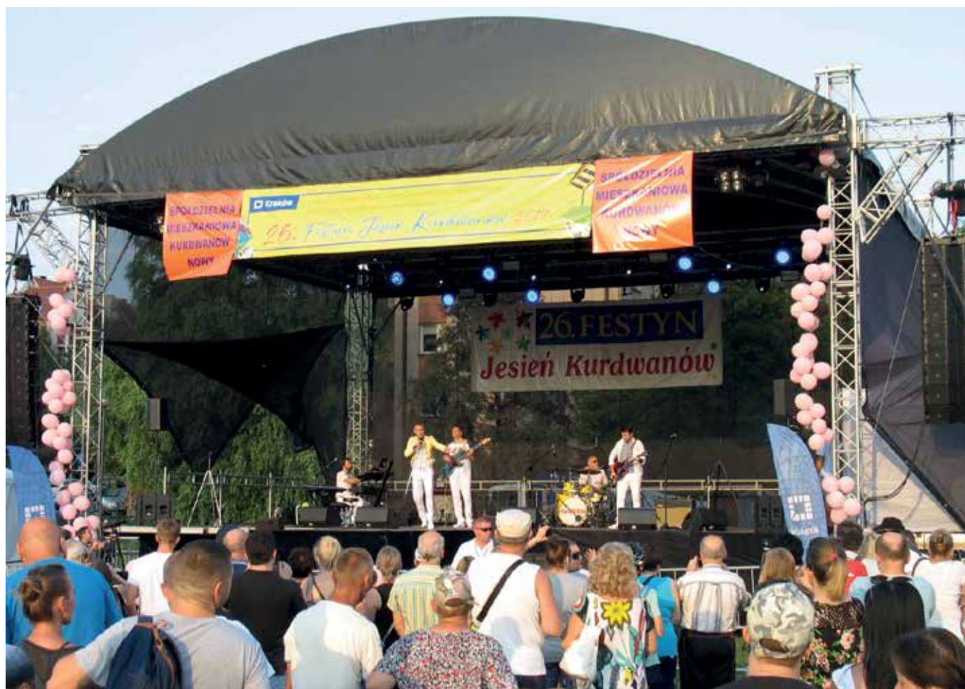
Występ zespołu Magic of the Queen