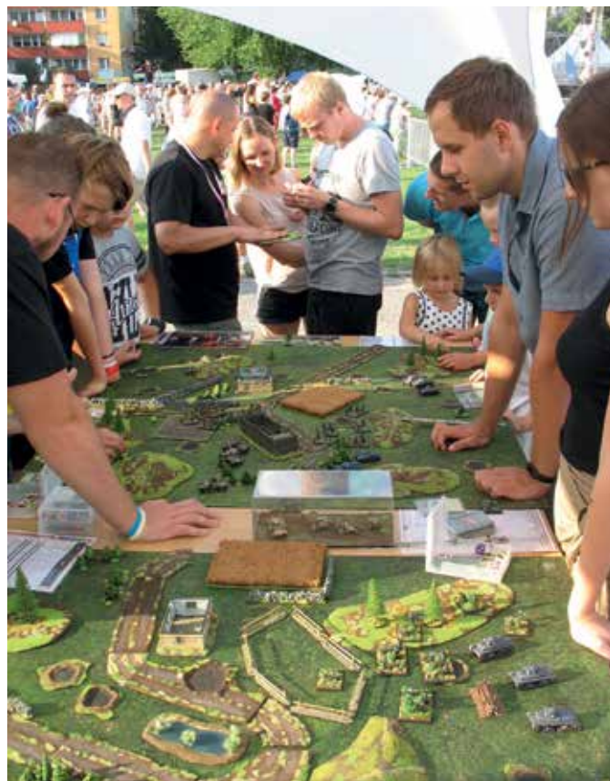
W trakcie imprezy prezentowano historyczną grę bitewną „Wrzesień 1939”