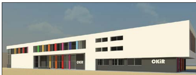
Sala gimnastyczna przy ul. Czarnogórskiej (wizualizacja)