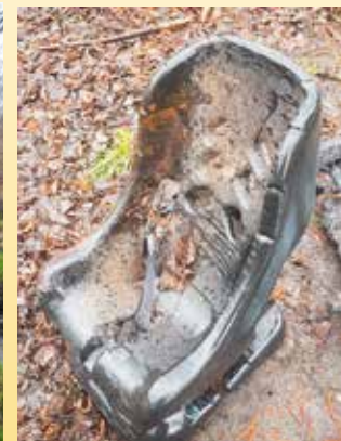
Czy tu doszło do jakiejś katastrofy? Tyle opon i jeszcze ten spalony fotelik samochodowy...