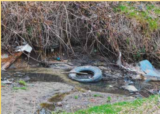
Tak wyglądało wiele zakątków Doliny Drwinki przed wkroczeniem ekipy sprzątającej