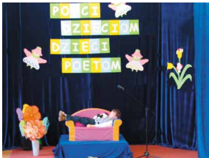
Maciej Jurczak z niezwykłą werwą i dojrzałością zaprezentował co robi prawdziwy leń