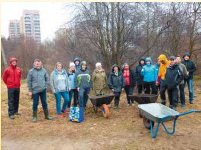
Wieje i pada, ale my nie uciekniemy. Zaraz ruszamy na poszukiwanie „skarbów”

Przebieg wiosennego sprzątania najlepiej prześledzić na zdjęciach wykonanych przez Agnieszkę Mędręk, Bożenę Izabellę Kiedach oraz Michała Ciechowskiego.