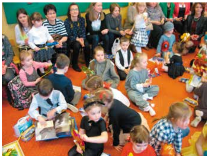
Nagrody rozdane, można się rozluźnić i porozmawiać o upominkach i wrażeniach