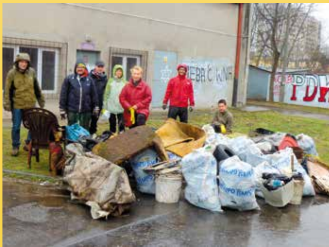
Już po sprzątanu. To tylko część znalezionych śmieci