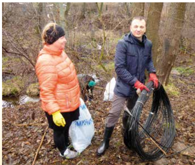
... może przydadzą się znalezione przez nas kable?