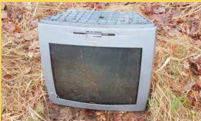
Ten telewizor wygląda na całkiem dobry...