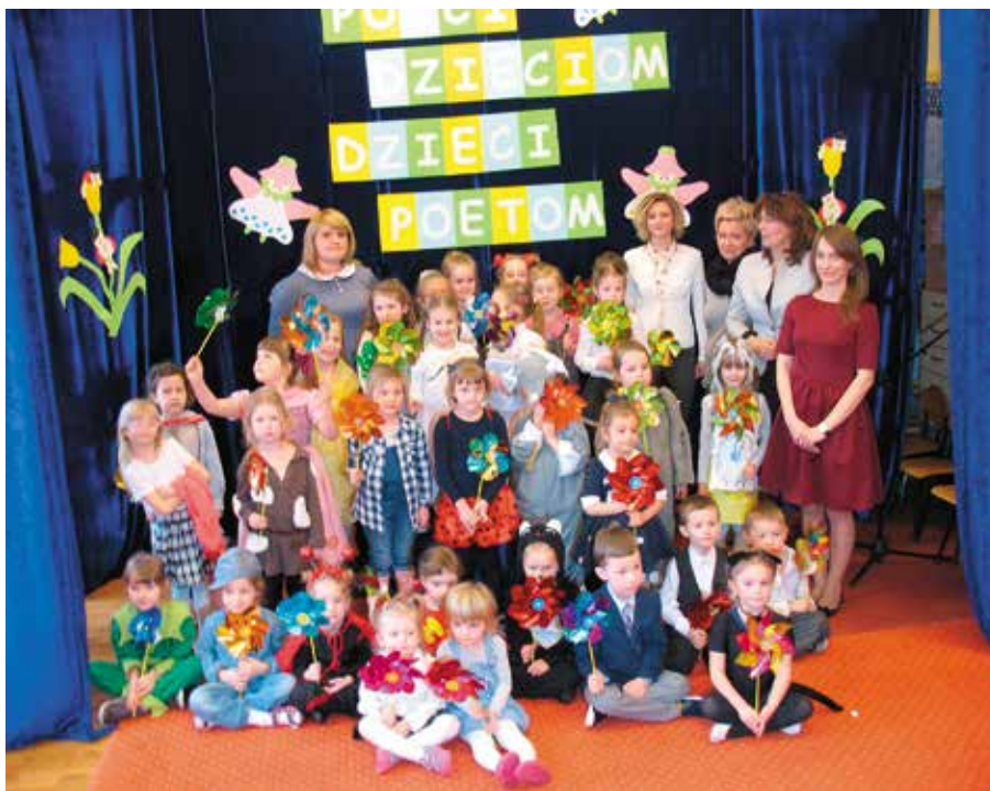
Uczestnicy konkursu, wraz z jurorami i gospodarzami spotkania