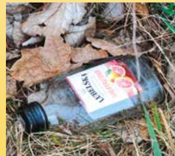
... może nie, może to tylko pozostałości po biwaku grupy znajomych