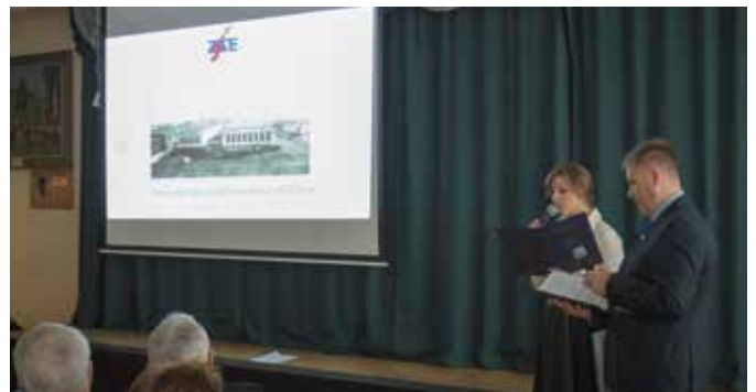
Historię szkoły przedstawiono w specjalnej prezentacji multimedialnej