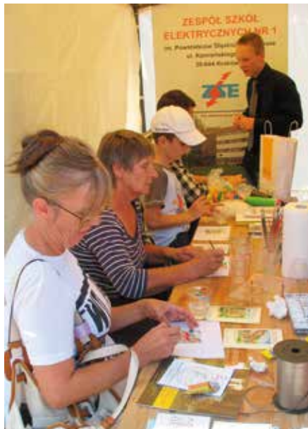
Pocztówki z Podgórze Duchackiego chętnie malowali młodzi i starsi

Uroczyste obchody jubileuszu były doskonałą okazją do zaprezentowania dorobku dzielnic, atrakcji na ich terenie, pochwalenia się tym, z czego lokalne społeczności są dumne. Wszystko to dzielnice prezentowały na Rynku Głównym. W namiotach można było spotkać się z radnymi poszczególnych dzielnic, uczestniczyć w zajęciach zorganizowanych przez placówki działające na terenie poszczególnych dzielnic, poznać ich urok i specyfikę, a na scenie obejrzeć dorobek artystyczny placówek kulturalnych.