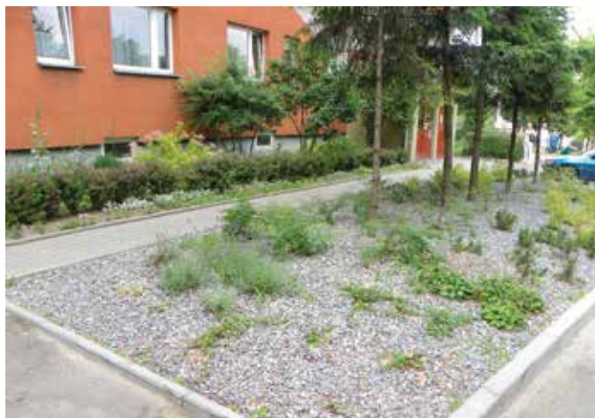
Ogród przy bloku przy ul. Podedworze 6