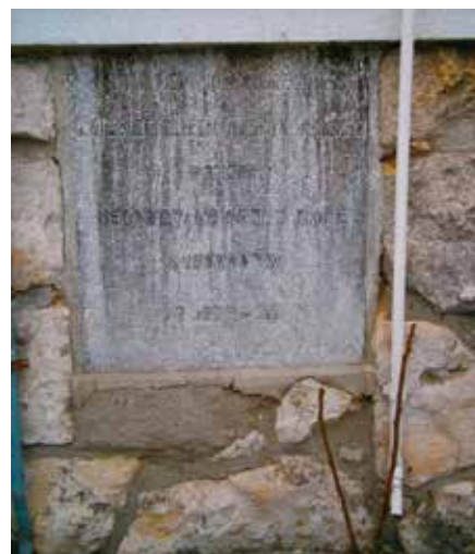
Tablica przed i po remoncie