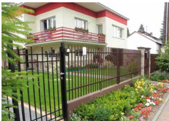
Ogród wzdłuż posesji przy ul. Turniejowej 38