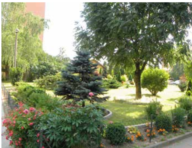
Ogród wokół bloku przy ul. Sławka 16