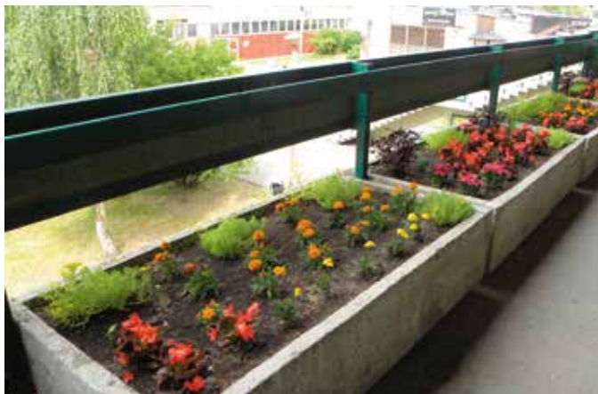
Taras Młodzieżowego Domu Kultury przy ul. Beskidzkiej