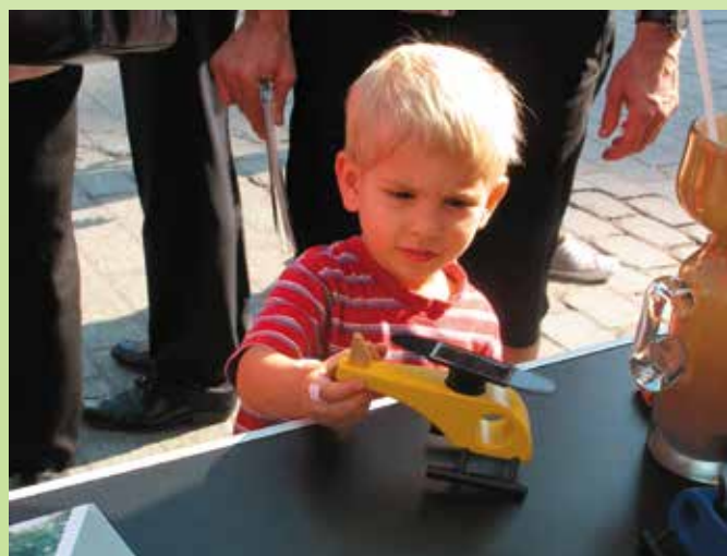
Czemu to się kręci... zdaje się pytać młody gość naszego stoiska