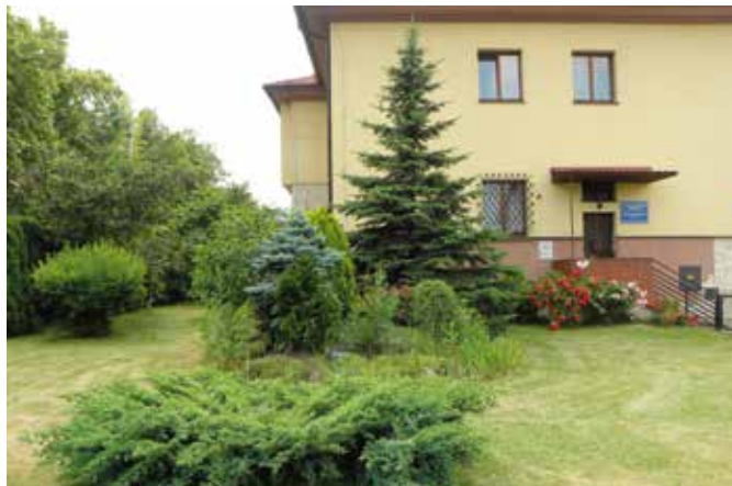
Ogrody na terenie parafii Zmartwychwstania Pańskiego