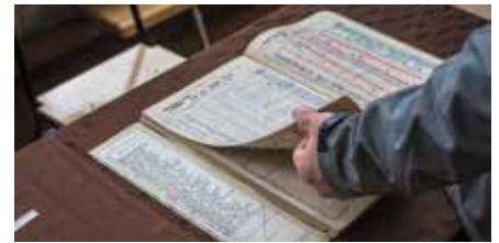
Absolwenci i nauczycieli z rozrzuconymi przeglądali archiwalne dzienniki

Wiele wspomnień i fotografii zostało zamieszczonych również w przygotowanym z tej