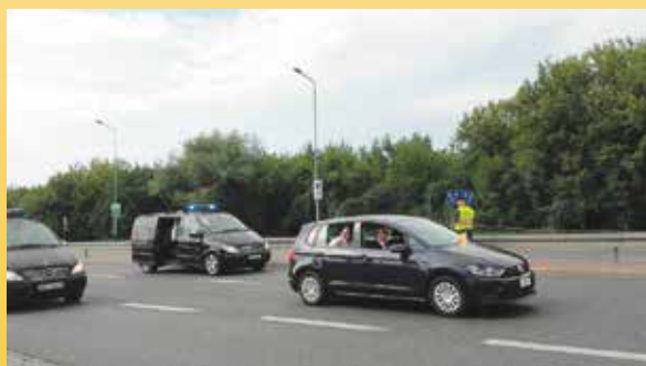
Trasa przejazdu papieża Franciszka do szpitala dziecięcego w Prokocimiu wiodła wzdłuż granic Dzielnicy XI. Prezentowane zdjęcie wykonała jedna z wychowanek SIEMACHA Spot Bonarka.