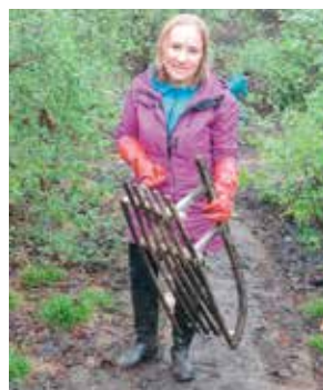
A ja mam sanki