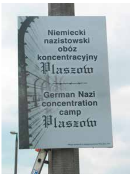
Jedna z tablic umieszczonych społeczными siłami w 2012 r.