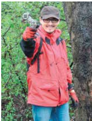
Konsola też była!

Nadążający za trendami w modzie również nie narzekali. Ja znalazłam gustowne buciki i torebkę