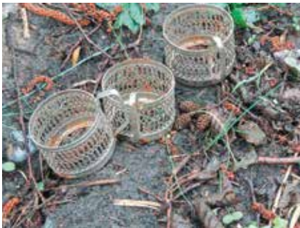
podstawki do szklanek,