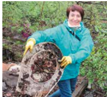
no i klapę sedesową...