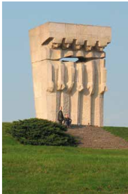
Pomnik Wyrwanych serc

Wszystko było jednak podporządkowane przedstawieniu historii KL Płaszów. Jego budowę Niemcy rozpoczęli pod koniec 1942 r. Początkowo był to obóz pracy przymusowej dla Żydów, ale wkrótce zaczęto tu przywozić osoby innych narodowości. W szczytowym momencie obóz, który zyskał status koncentracyjnego zajmował obszar ok. 80 ha położonych między dzisiejszymi ulicami Kamieńskiego, Helmana i Jerozolimską. Więziono tu w sumie ok. 150 tys. osób. Tutejsi więźniowie pracowali w pobliskim