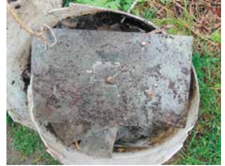
w brakującą szybę piekarnika,