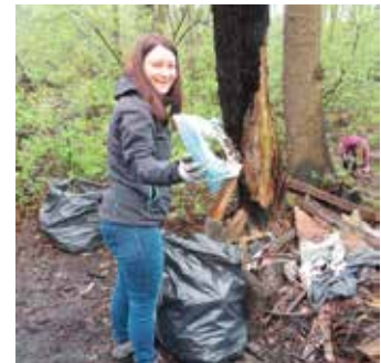
... a ja dorzucę jeszcze żelazko