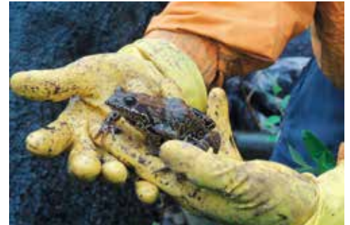
Zaczarowany książę czy księżniczka...