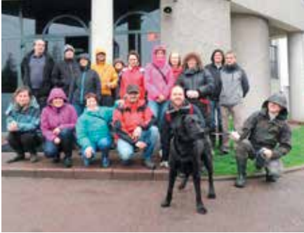
Za chwilę ruszamy do teren...

Kilkanaście osób, wspomaganych przez psa tropiącego, wyruszyło w kwietniu do źródła potoku Drwinka, by odkopać je spod zwałów wszelakich śmieci. Po wielu godzinach pracy, napełnieniu ponad 100 (!!!) ogromnych worków i zgromadzeniu wielkiej góry tego, co się do nich nie zmieściło, wszyscy padli ze zmęczenia. Szczęśliwi i dumni z dokonania.