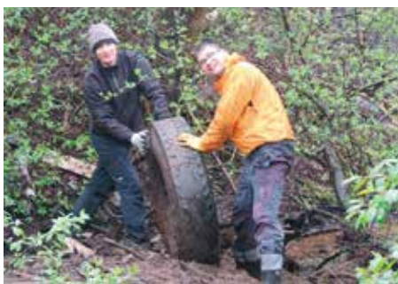
Poprzednicy nie zabrali wszystkich opon. Mamy kolejną!