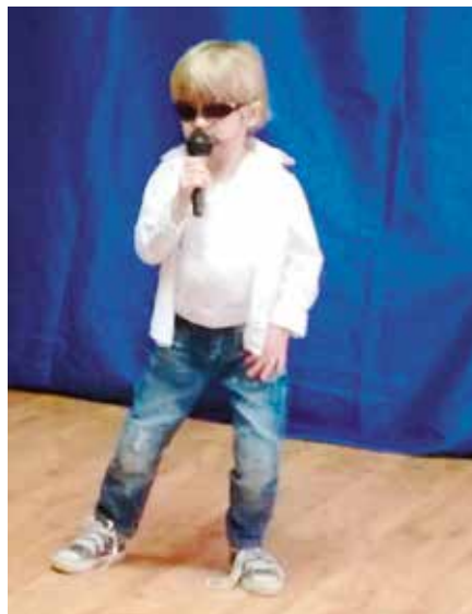
Wiele osób lubi parodiować innych, a poza tym miło jest poczuć się choć na moment gwiazdą.

Zachęceni brawami na scenie pojawiali się kolejni młodzi artyści prezentujący swój utwór.