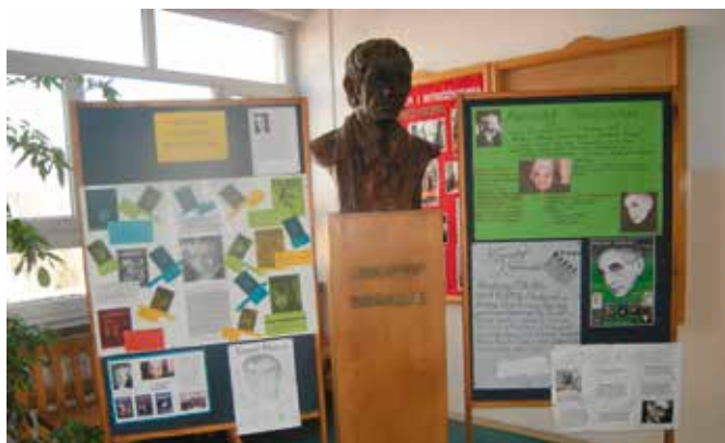
Prezentacja poświęcona Krzysztofowi Kieślowskiemu