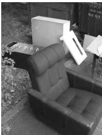
„Dziką” Lamusownię ktoś urządził obok śmietnika przy ul. Heila (zdjęcie z 4 września).

Chcąc z niej skorzystać należy wcześniej skontaktować się z firmą – do końca tygodnia