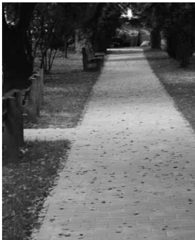
Na terenie Przedszkola nr 163 przy ul. Podedworze wyremontowano chodnik w ogrodzie i schody do niego