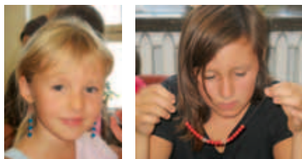
Dziewczęta z dumą prezentowały własnoręcznie wykonane ozdoby

Świetlica Terapeutyczna „Ikar” przygotowała m. in. zajęcia plastyczne, turniej tenisa stołowego, spotkanie ze strażnikiem miejskim, pokaz dogoterapii, zajęcia teatralne z aktorami Teatru Nicoli. Dzieci wyruszyły na spotkanie ze strażakami z Jednostki Ratowniczo-Gaśniczej na ul. Rzemieśniczej, do Ogrodu Doświadczeń, Muzeum Lotnictwa, Muzeum Etnograficznego