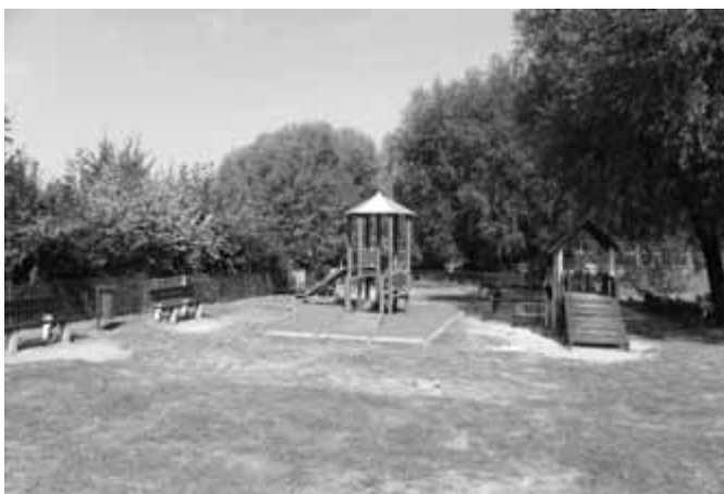
Nowe elementy w ogródku jordanowskim przy ul. Heila