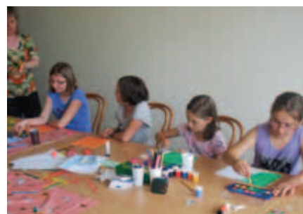
Zajęcia plastyczne w Klubie „Piaskownica”