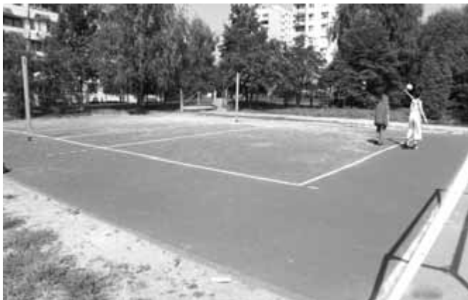
Nowa – poliuretanowa – nawierzchnia na boisku do siatkówki przy Szkole Podstawowej nr 55 przy ul. Dobczyckiej