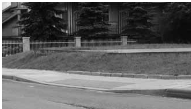
Po obu stronach ul. Łużyckiej obniżono krawężnik, by ułatwić komunikację między osiedlami Piaski Nowe i Kurdwanów osobom starszym, matkom z wózkami