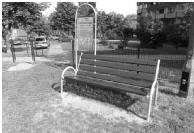
Ogródek jordanowski przy ul. Podedworze wzbogacił się o ławki i ogrodzenie