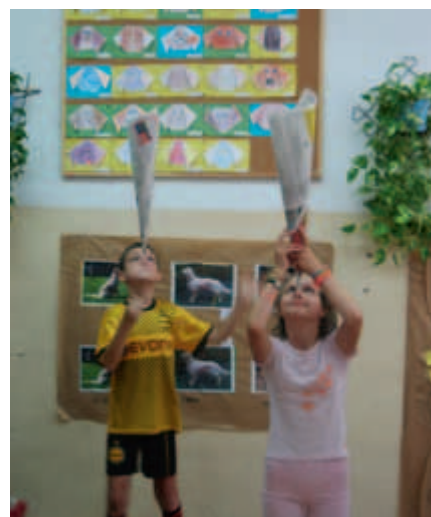
Ćwiczenia podczas zajęć z Teatrem „Nicoli”