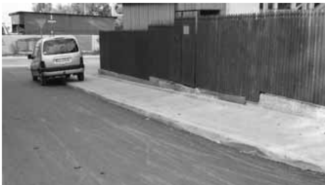
Podczas remontu ulicy Andrychowskiej okazało się, że na pewnym odcinku nie ma podbudowy. Trzeba było ją uzupełnić, wyrównać poziom jezdni i na koniec położyć asfalt