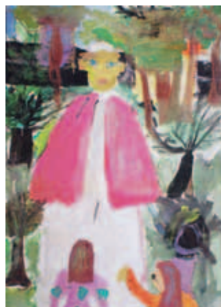
Julia Słonecka, Szkoła Podstawowa nr 55