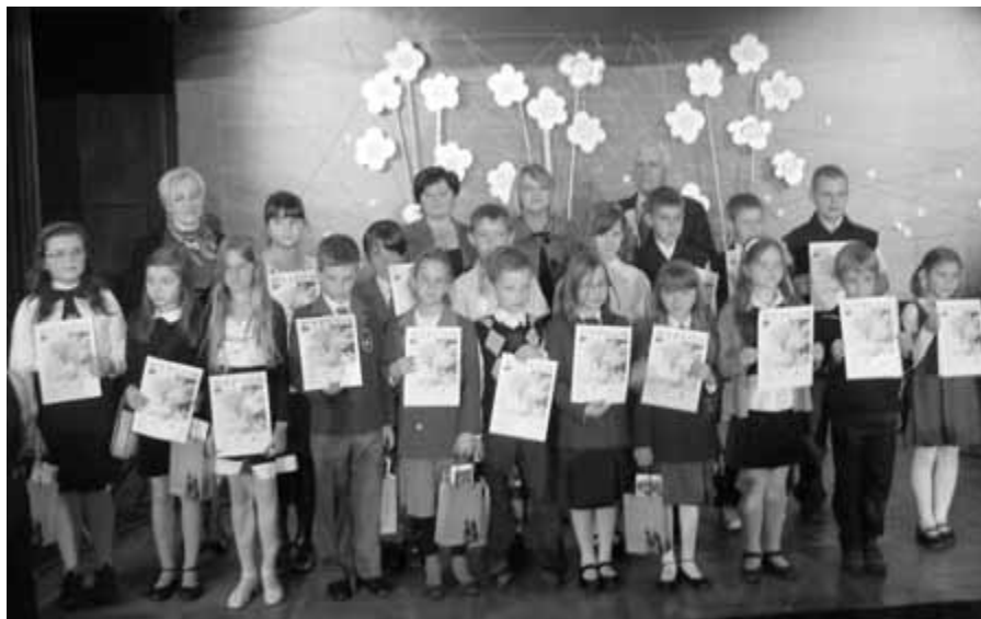
Laureaci konkursu literackiego.