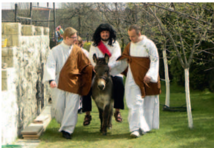
Przygotowania do procesji palmowej, Wola Duchacka