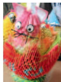
1. miejsce w kategorii prac zbiorowych – szkoła podstawowa

z Wielkanocą (zajączki, kurczaczki), ale pojawiły się też „Matka z synkiem”, diabeł i anioł, rybka oraz różne postacie z „oczkami”. W każdej z prac widać było zaangażowanie twórcy i każda z nich była szczególna.