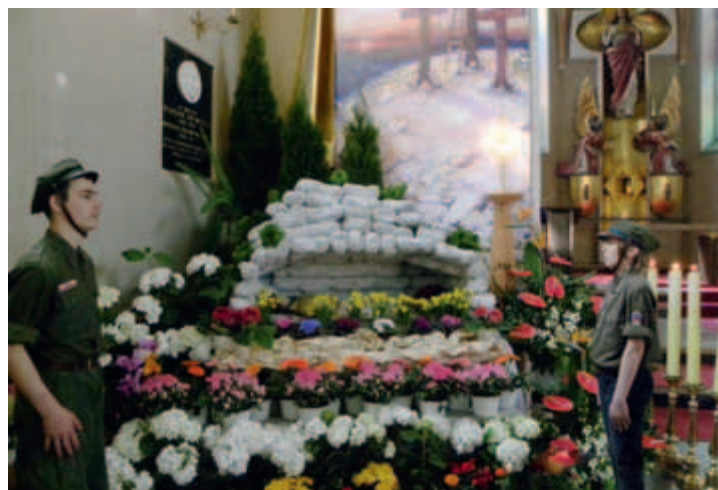
Grób Chrystusa w kościele p.w. Najświętszego Serca Pana Jezusa, Piaski Wielkie Fot. Adam Zabdyr