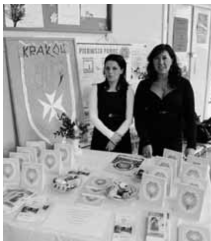
„Stoisko” Szkoły Podstawowej nr 90