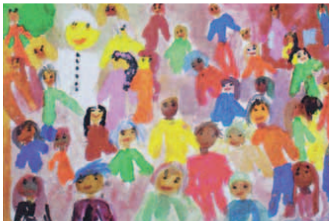
Sandra Romek, Szkoła Podstawowa nr 27