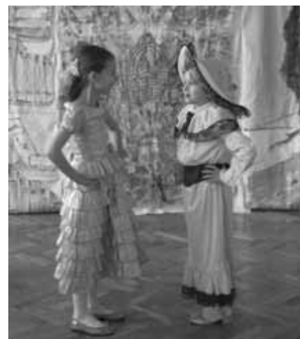
Ostatnie przygotowania do przedstawienia.