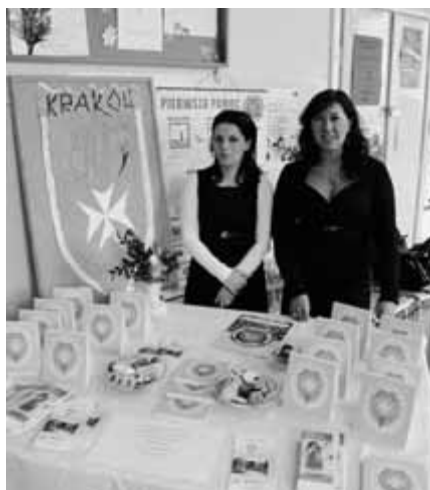
„Stoisko” Szkoły Podstawowej nr 90