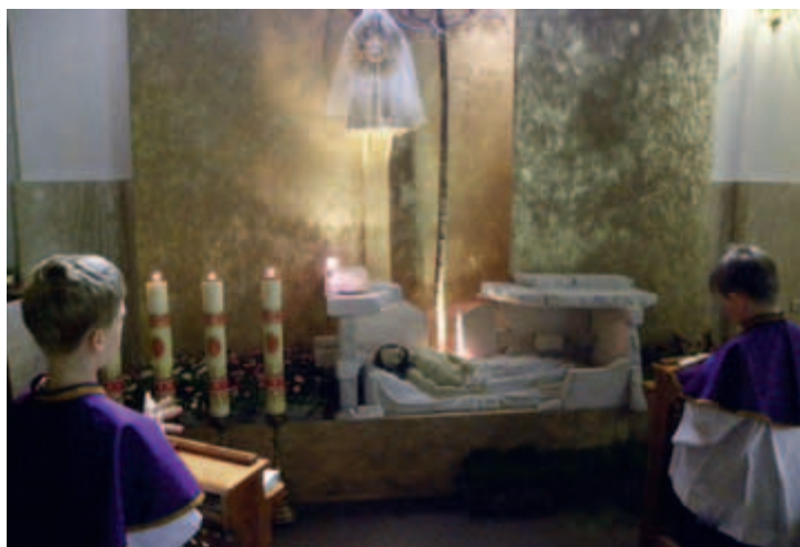
Grób Chrystusa w kościele p.w. Matki Bożej Różańcowej, os. Piaski Nowe