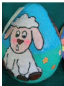
1. miejsce w kategorii gimnazjum