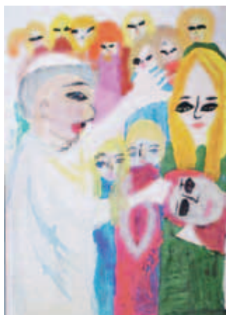
Alicja Walińko, Szkoła Podstawowa nr 27