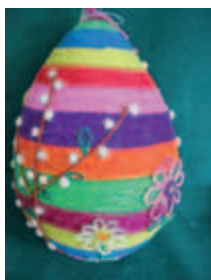
1. miejsce w kategorii klas I - III