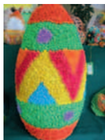
1. miejsce w kategorii Pisanka Smocza