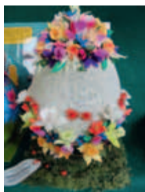
1. miejsce w kategorii klas IV - VI