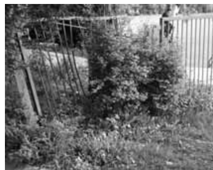
Ogrodzenie terenu „Armatury”

Z kolei głównym problemem gospodarzy obiektu Klubu Sportowego „Grzegórzecki” przy ul. Wysłouchów 34 jest wada konstrukcyjna dachu. Nie pomagają żadne uszczelnienia, doraźne działania. Woda wciąż gdzieś wnika w po-